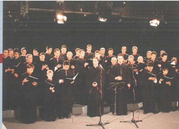
ΑΘΗΝΑ STUDIO ΕΡΤ (Μεγ. Εβδομάδα 2002)

Από το Σεπτέμβριο του 2000 καθιέρωσε το θεσμό της Συνάντησης Βυζαντινών Χορωδιών Δράμας στη μνήμη του Εθνοϊερομάρτυρα Μητροπολίτη Δράμας-Σμύρνης Χρυσοστόμου και της πολιούχου της πόλης της Δράμας Αγ. Βαρβάρας. Εμφανίστηκε σε τηλεοπτικά και ραδιοφωνικά Μ.Μ.Ε. με αποκορύφωμα την παραγωγή με ύμνους της Μ. Εβδομάδος για την κρατική τηλεόραση (NET) το Πάσχα 2002.